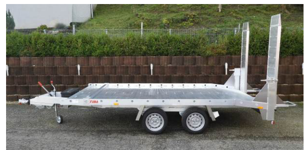
einteilige Auffahrrampen in Fahrstellung