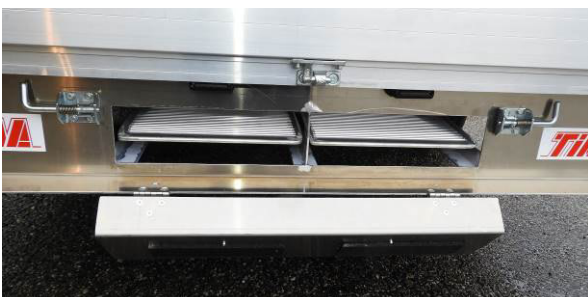
Rampeneinschub mit Klappe nach unten