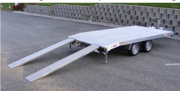
zweiteilige Auffahrrampen in Fahrstellung